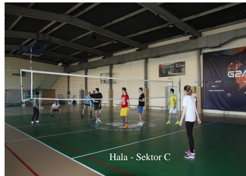
Hala - Sektor C

Każdy student ma obowiązek zgłosić się w pierwszym tygodniu semestru na halę w bud. Ł w terminie wskazanym w rozkładzie zajęć dla grupy, do której jest przypisany.