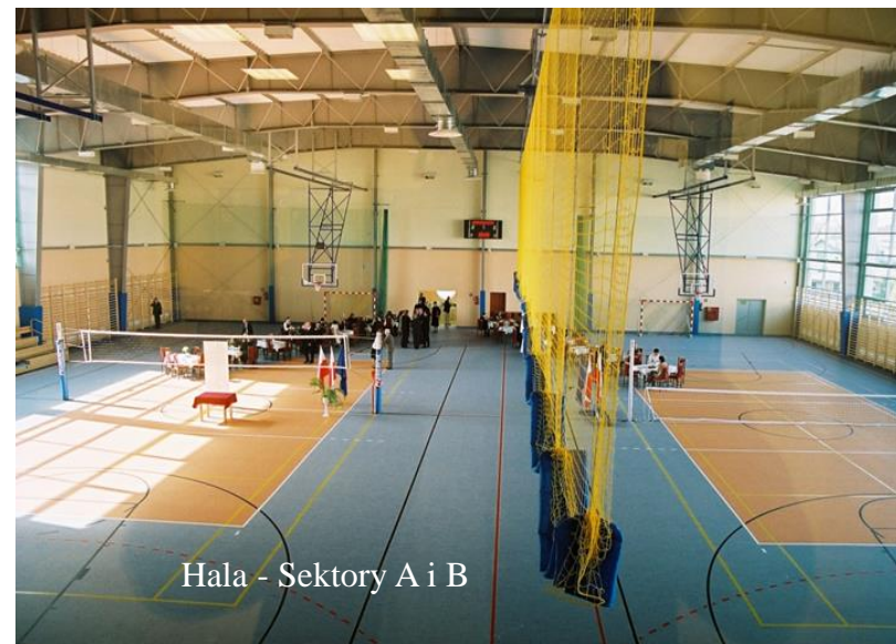
Hala - Sektory A i B

Hala sportowa w bud. Ł (sektory A, B, C)